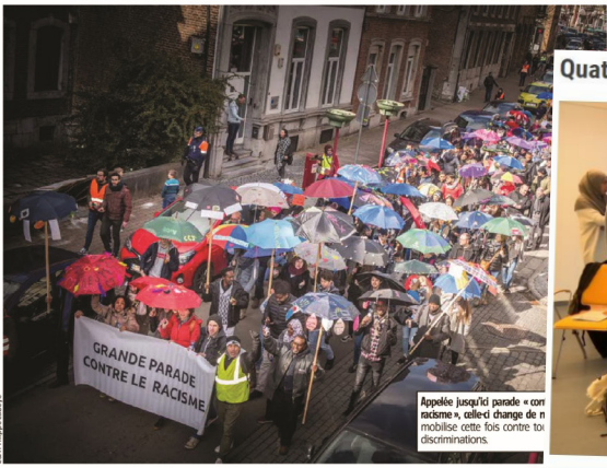
Appelée jusqu'ici parade « anti-racisme », celle-ci change de nom et mobilise cette fois contre tous les discriminations.

tions. C'est la première fois que nous organisons un atelier d'impro avec des enfants. Faire parler les petits sur ce thème va être intéressant. Le public scolaire qui est très mixte est hyper important pour nous. La réelle plus-value, c'est que ça se fasse au Grand-Théâtre. C'est très symbolique dans la revitalisation de Verviers. Nous devons montrer qu'il n'est pas mort. De plus, les enfants qui vont participer n'y sont probablement jamais rentrés. C'est une chouette opportunité de les associer à ce lieu. ■