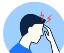
Dureri de cap